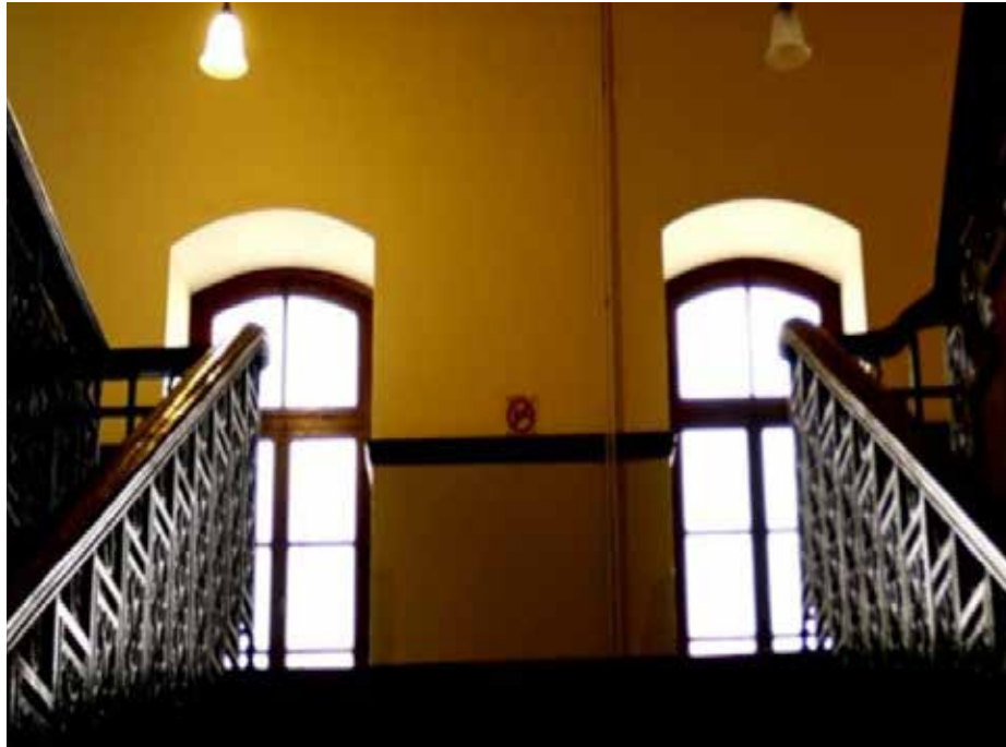
Εσωτερικό Παλαιάς Φιλοσοφικής