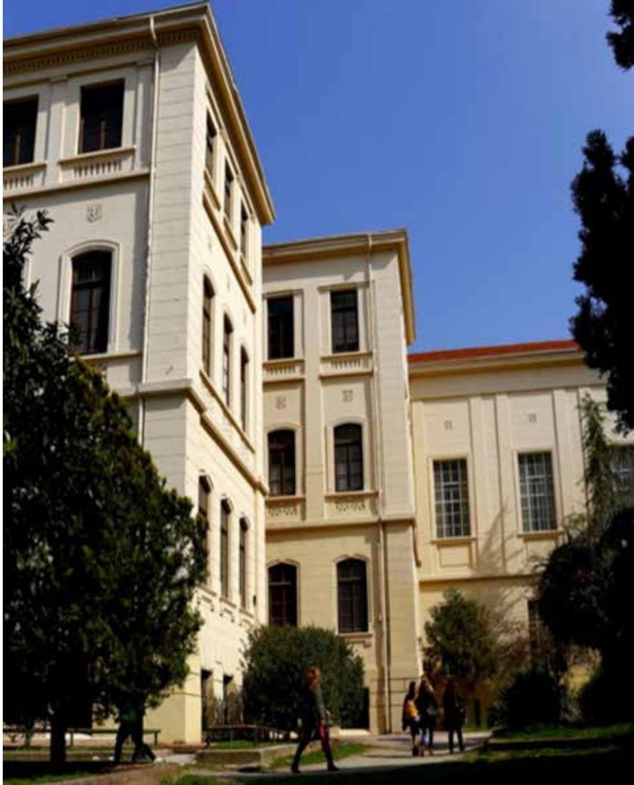
Παλιό Κτίριο Φιλοσοφικής Σχολής