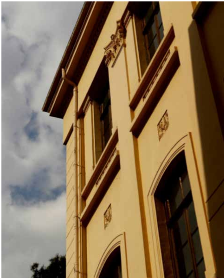
Άποψη Παλαιού Κτιρίου Φιλοσοφικής Σχολής