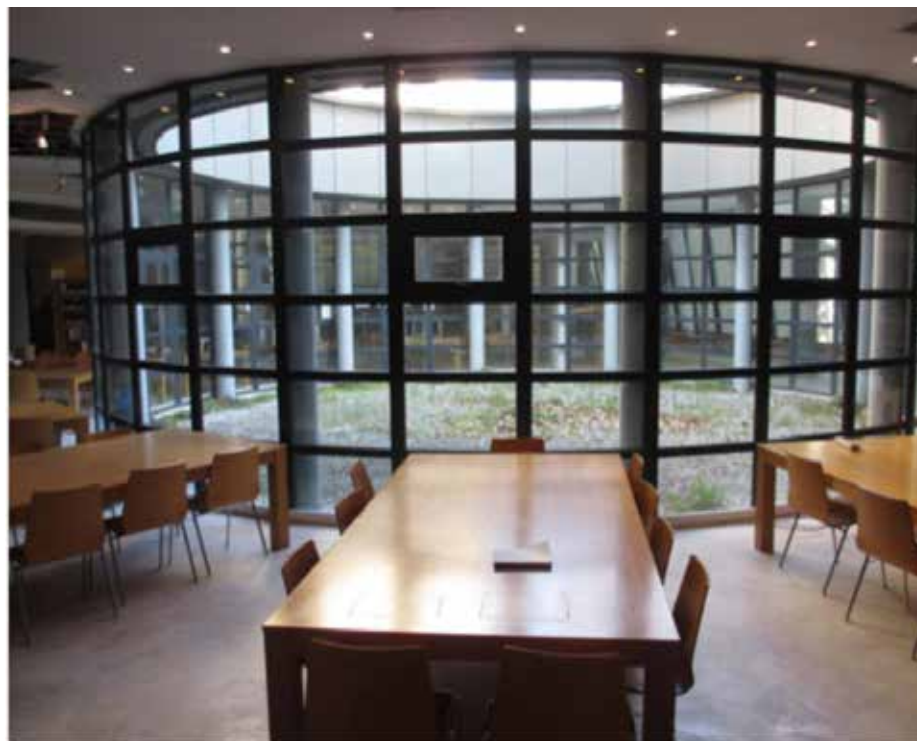
Θεματική Βιβλιοθήκη Φιλοσοφικής Σχολής

Περισσότερες πληροφορίες είναι διαθέσιμες στην ιστοσελίδα της Μονάδας Διασφάλισης Ποιότητας (ΜΟΔΙΠ-ΑΠΘ http://qa.auth.gr ) και στην ιστοσελίδα του Τμήματος.