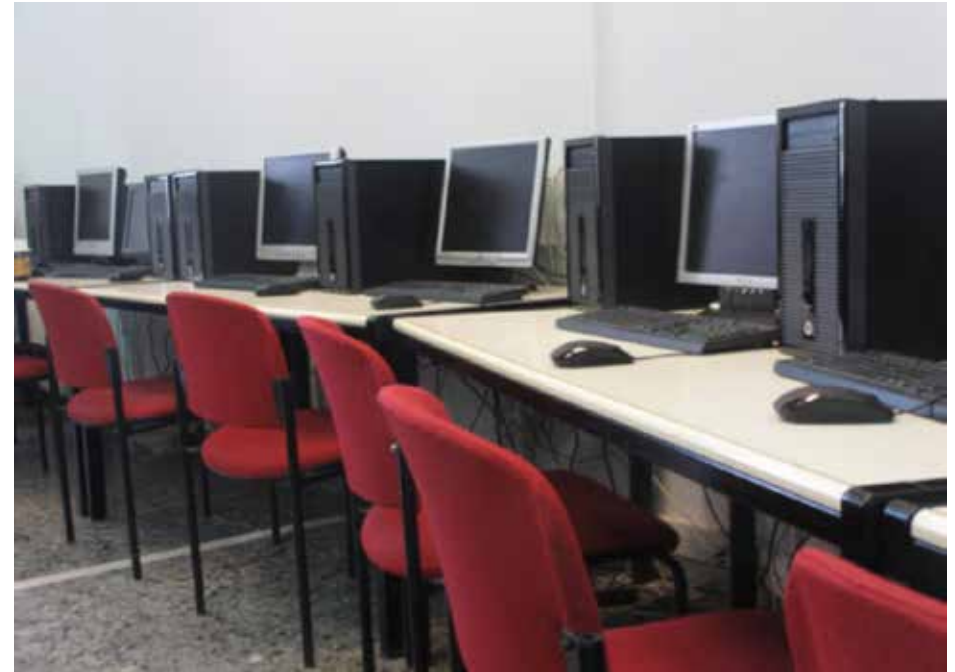
Άποψη Ψυχολογικού Εργαστηρίου

Το Εργαστήριο της Γνωστικής Νευροεπιστήμης καλύπτει τα γνωστικά αντικείμενα στην περιοχή της Πειραματικής Ψυχολογίας, της Γνωστικής Ψυχολογίας, της Ψυχολογίας της Γλώσσας, της Νευροψυχολογίας και της Βιολογικής Ψυχολογίας, που ανήκουν στις ευρύτερες περιοχές της Πειραματικής Ψυχολογίας, της Γνωστικής Ψυχολογίας και της Γνωστικής Νευ-