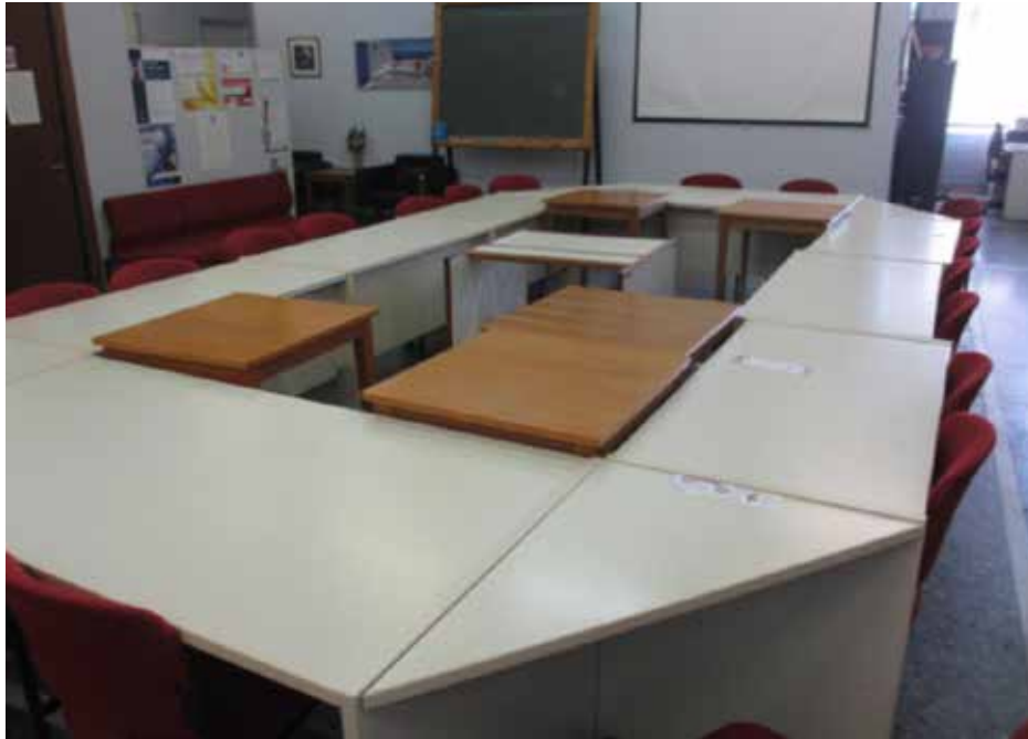
Άποψη Ψυχολογικού Εργαστηρίου