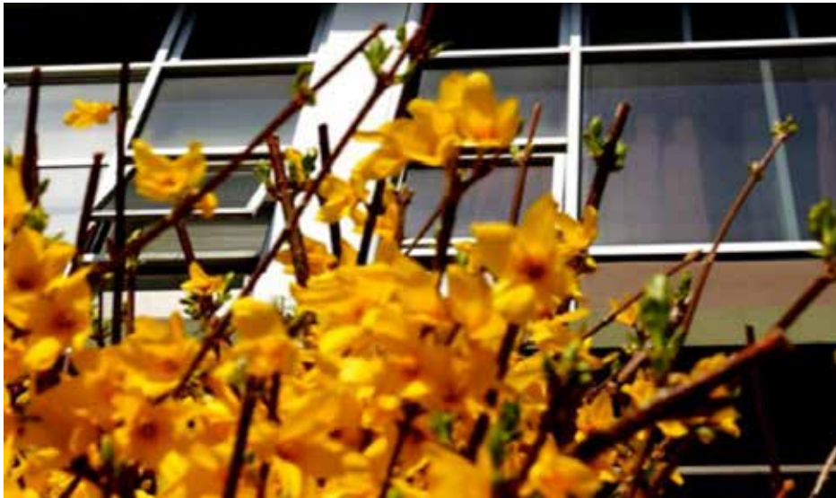
Άποψη Νέου Κτιρίου Φιλοσοφικής Σχολής